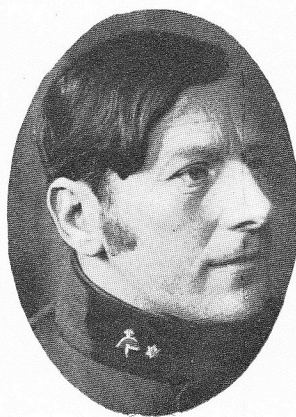
DE MOT, Jean , né le 26 août 1876, à Bruxelles.

Capit.-Com' du Génie, détaché à l'Aérostation. O. L.; C. G. Trouva la mort des braves, en même temps que son lieutenant Jean De Mot, le 5 oct. 1918, à Passchendaele, en quittant son abri pour assurer la liaison de sa compagnie d'aérostiers avec un groupe d'artillerie.