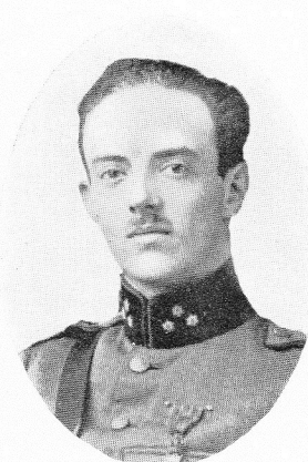
ECKSTEIN, Serge , né le 10 novembre 1888, à Anvers.

Capit.-Com' du Génie, détaché à l'Aérostation. O. L.; C. G. Trouva la mort des braves, en même temps que son lieutenant Jean De Mot, le 5 oct. 1918, à Passchendaele, en quittant son abri pour assurer la liaison de sa compagnie d'aérostiers avec un groupe d'artillerie.